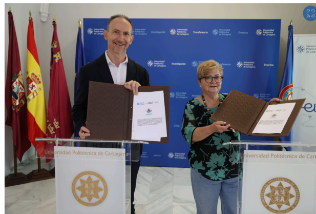
El Rector y la presidenta de ADAHI, mostrando el convenio firmado.