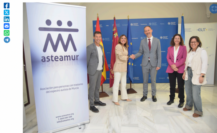
El Rector estrecha la mano de la presidenta de Asteamur.