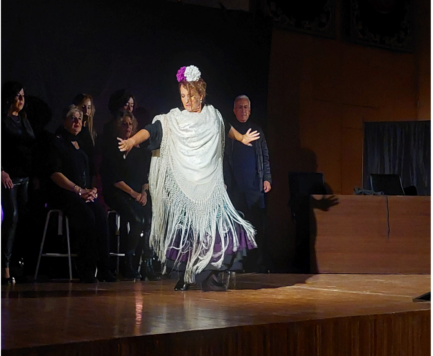
Una de las actrices del grupo, durante la interpretación de la obra.